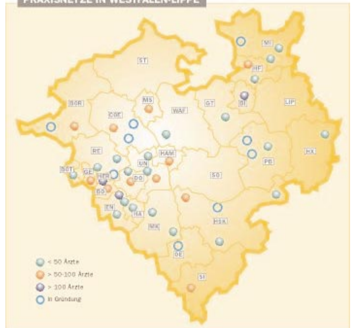
PRAXISNETZE IN WESTFALEN-LIPPE

Konkrete Formen für neues Vergü- tungssystem Seite 13