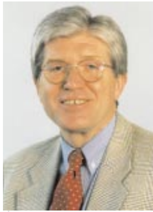
Dr. Ingo Flenker, Präsident der ÄKWL

Um die Ärztinnen und Ärzte in Westfalen-Lippe mit der EBM vertraut zu machen, bietet die gemeinsam von ÄKWL und KVWL getragene Akademie für ärztliche Fortbildung ab Herbst Kurs-Module zu Grundlagen, Anwendung und Integration der EBM in den Arbeitsalltag an. Eine Auftaktveranstaltung dazu findet am 6. September in Dortmund statt. Wir hoffen, auf diesem Wege die EBM stärker etablieren zu können und dem Arzt ein Instrument an die Hand zu geben, mit dem er die Behandlung seiner Patienten optimieren und auf einem nachweisbar hohem Niveau durchführen kann.