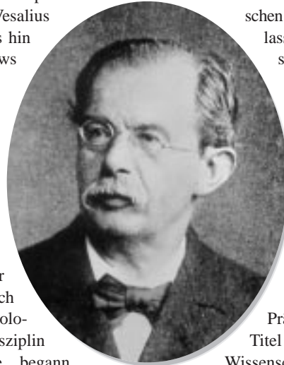
Friedrich Daniel von Recklinghausen

Im zweiten Teil der Präsentation wird mit Druckwerken aus dem 17. Jahrhundert und Präparaten aus dem 19. und 20. Jahrhundert die Entstehung der Pathologie als medizinische Fachdisziplin an Beispielen von Andreas Vesalius (1514 – 1564) bis hin zu Rudolf Virchows grundlegender „Zellularpathologie“ von 1858 gezeigt. Während die französische Regierung in Straßburg bereits 1819 den weltweit ersten Lehrstuhl für die damals noch anatomische Pathologie genannte Disziplin eingerichtet hatte, begann der Aufstieg des Faches in Deutschland